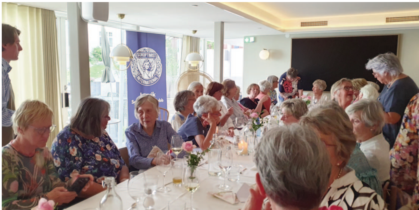
God stemning blant soroptimster fra Larvik, Sandefjord og Friesland-Zuid i Nederland.

«Det hele begynte rundt århundreskiftet i den lille fisker- og loshavnen Nevlunghavn, ytterst mot den ville overfarten til Skagerak, helt på begynnelsen av Sørlandet.