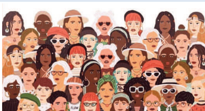
LARVIK SOROPTIMISTKLUBB larvik.soroptimistnorway.no/