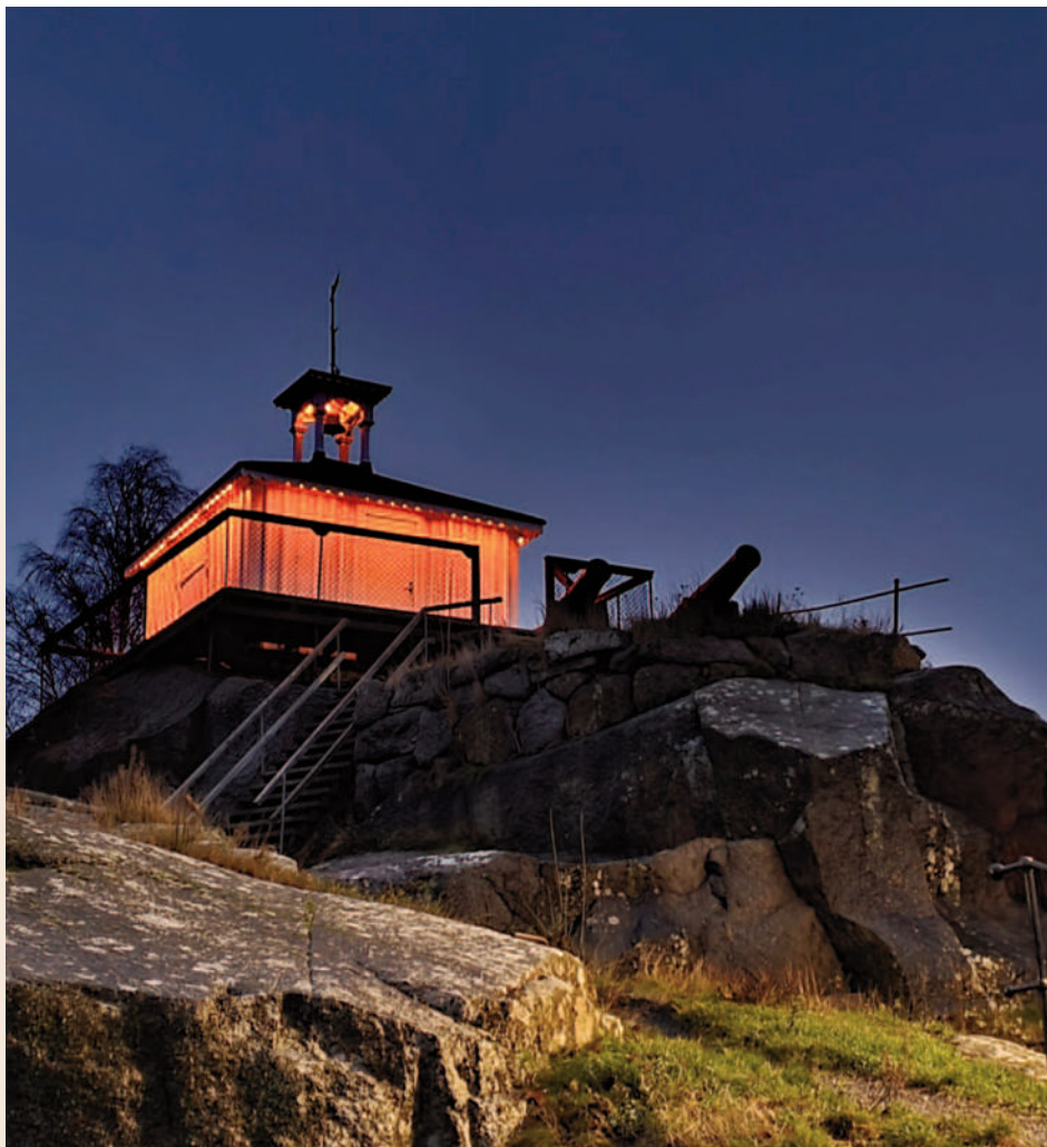
Den gamle brannvakta som troner høyt over byen på Bøkkerfjellet, fikk oransje lyssetting i den mørke novemberkvelden. Godt synlig!

Godt synlig er også bussreklamen Larvik og Sandefjord har gått sammen om!