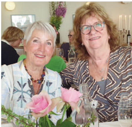
Mette fra Sandefjord sammen med Abeltje fra Nederland