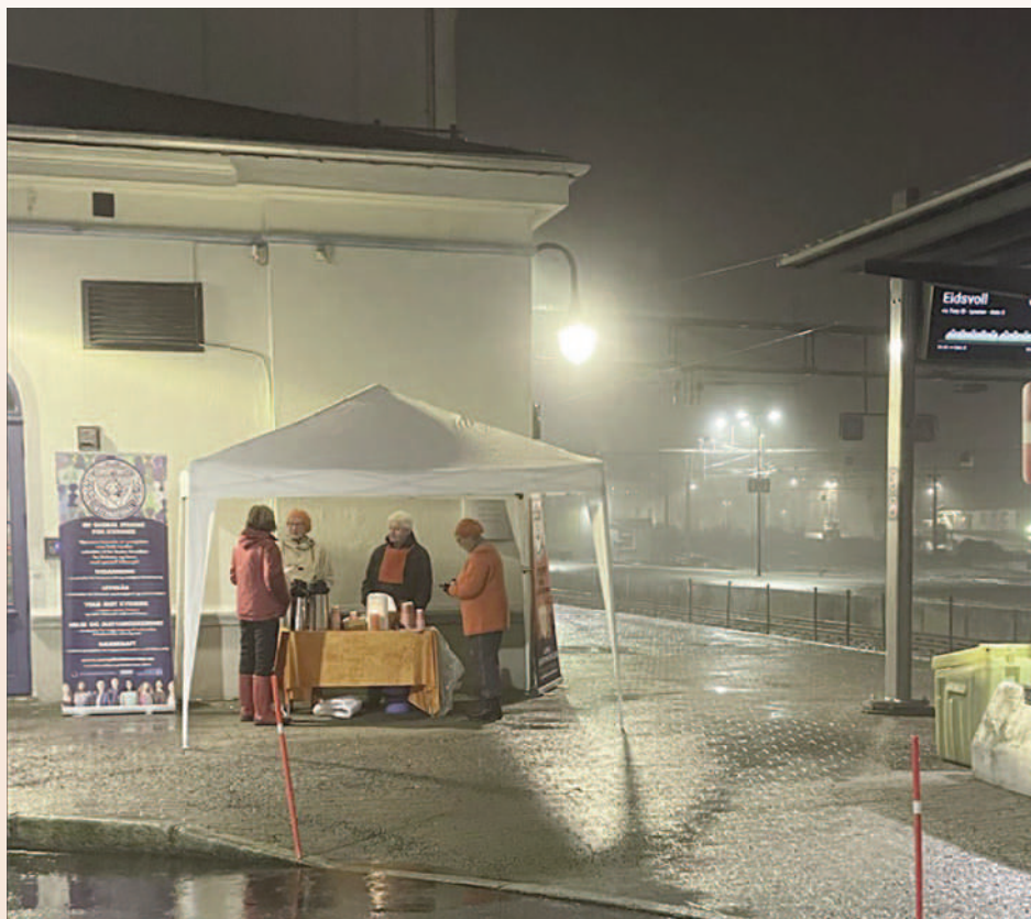
Klokken 06.00 - tåka lå ullen over jernbanestasjonen og det regnet stille. Vi var klare med kaffe og pepperkaker, informasjon og hyggelig prat med pendlere.