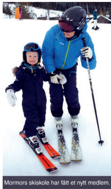
Mormors skiskole har fått et nytt medlem.