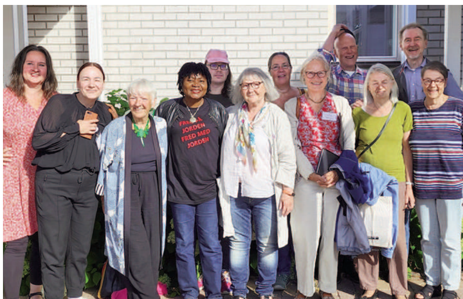
Den nordiske WPS gruppe, som allerede er i gang.