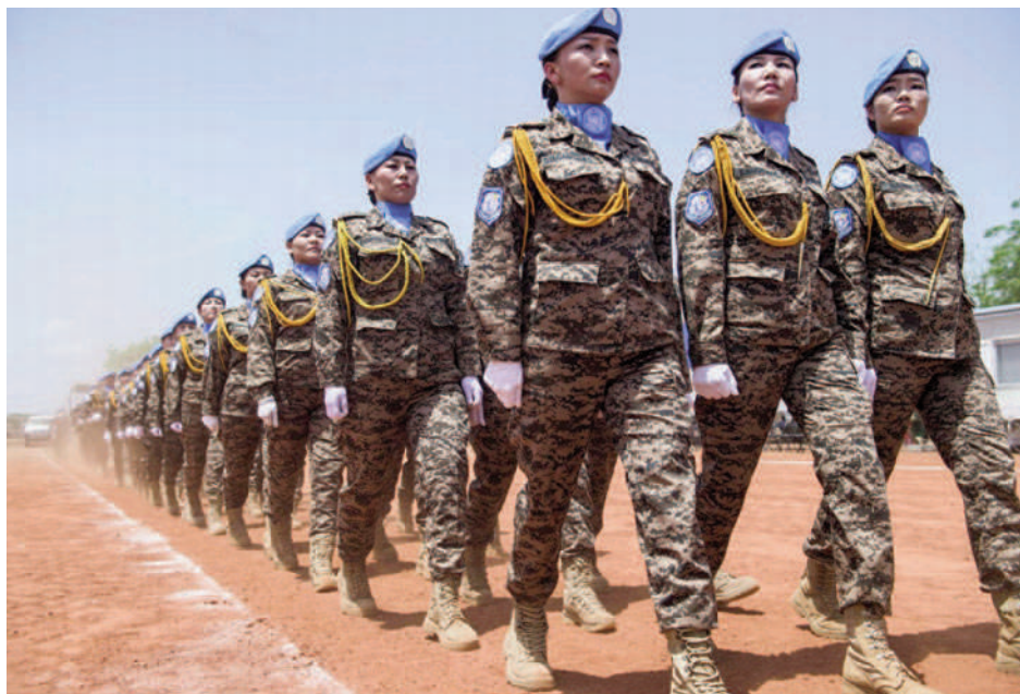
Således ser Det Danske Institut for International Studier, DIIS, vores indsats i sikkerhedsrådet, FLERE KVINDER I MILITÆRET.

Kvindernes internationale Liga for Fred og Frihed, leder.