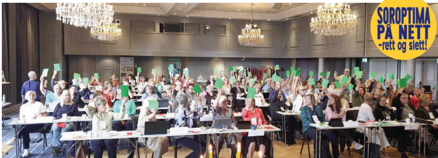
Mange grønne stemmer da representantskapet valgte å droppe papirutgave av Soroptima og bare satse på nettutgave.

som skal opp, og også på forhånd komme med forslag til endringer eller ting klubbene ønsker skal tas opp. Viktige ting skal drøftes og vedtas, selv om vi i stor grad er bundet av det som bestemmes av SI og av SIE. Men for at vi skal kunne påvirke og være med å bestemme også internasjonalt, er det viktig å følge med og si fra, stemme.