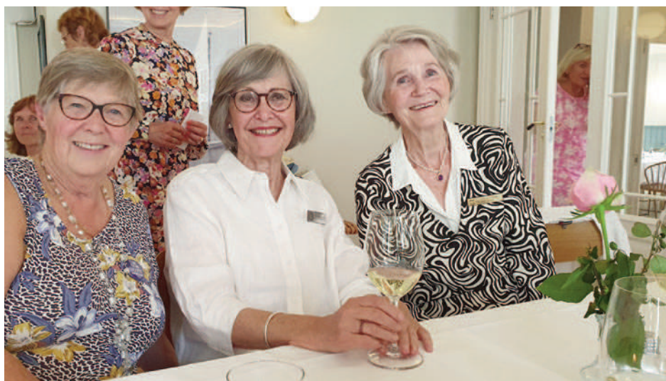
Blide jenter som hygget seg på sommermøtet:

Nevlunghavn Gjestgiveri har alltid hatt magien du forventer fra et badehotell man kommer tilbake til. Gylne glass og hummer på hvite duker. Spennende sjøhistorie med kjekke loser og tragiske forlis. Kombinasjonen mellom røff sjø og delikate sukkerkringler fra konditoriet, unger som fisker krabber, selskap under lysekronene med utsikt til seilbåtmaster i fullmåne. Et snev av sigar i natten. Livet begynte i havet – og så fortsatte det på Nevlunghavn Gjestgiveri.»